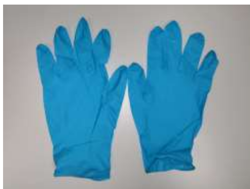
FOTO CAMPIONE PHOTO OF SAMPLE

Responsabile Laboratorio Chimico Chemical Laboratory Manager